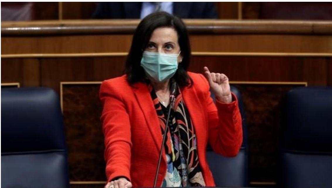
La ministra de Defensa Margarita Robles

La iniciativa es de un juez inhabilitado y apartado de la carrera por prevaricación que dirige una asociación